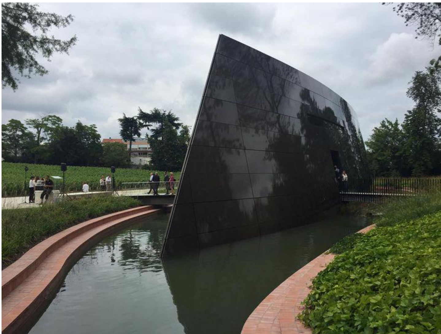
Un chai de 2000 mètres carrés sur 4 niveaux en plein coeur de Bordeaux

C'est l'aboutissement des nouvelles installations du Château les Carmes Haut-Brion , seul grand cru classé au coeur de Bordeaux , dans les vignobles de Pessac-Leognan . Depuis 2010 et l'acquisition du Château par Patrice Pichet , le PDG du même nom, ce chai est une nouvelle pierre à l'édifice. Les travaux avaient débuté il y a deux ans et ont coûté 9 millions d'euros .