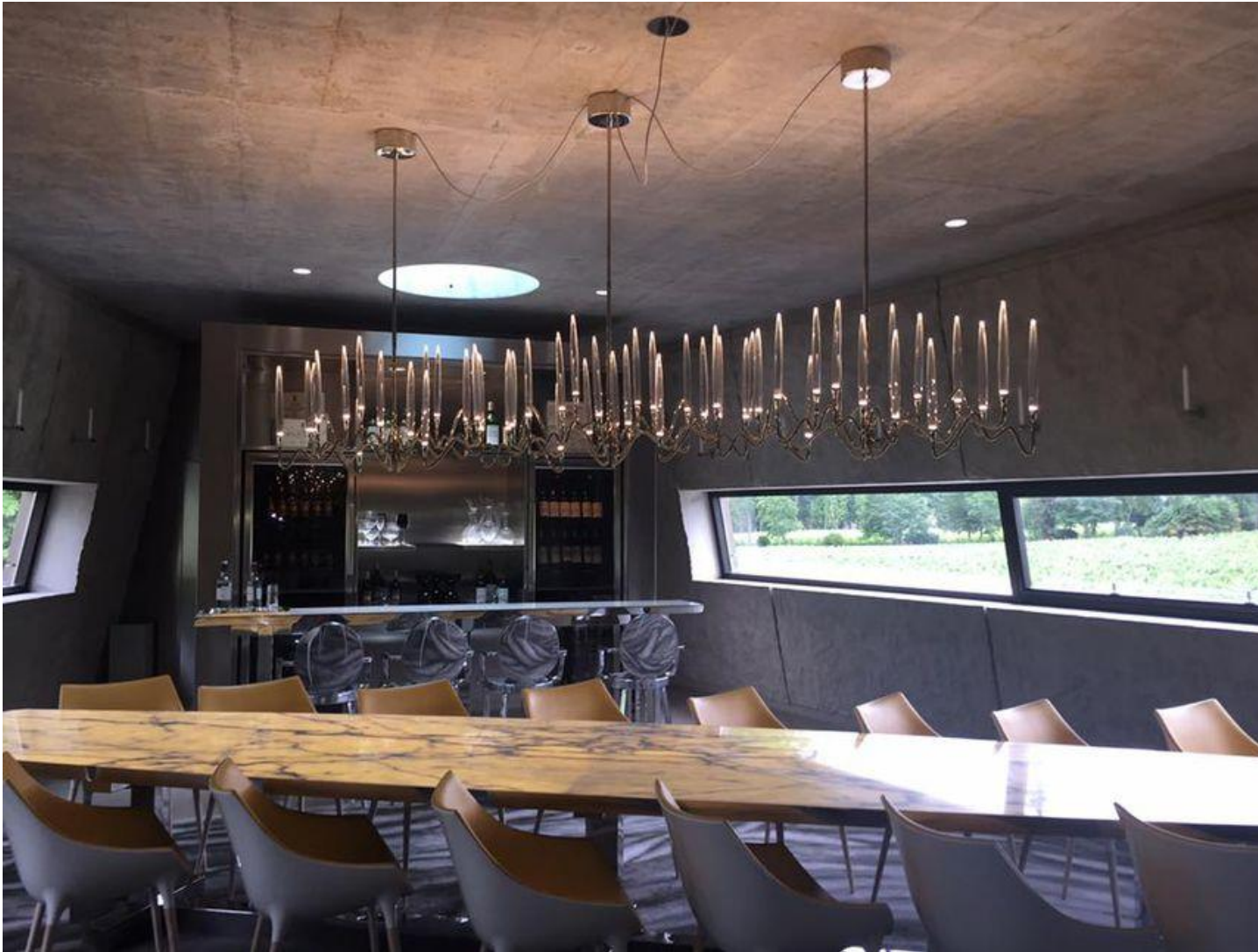
La salle de dégustation au troisième étage du Chai avec vue sur le cuvier

En fait le créateur français a voulu refléter le vin du Château dans ce chai. Une création unique qui ne ressemble à aucun autre chai, voilà le challenge. Le moins que l'on puisse dire et que le pari semble réussi aux vues des réactions lors de l'inauguration.